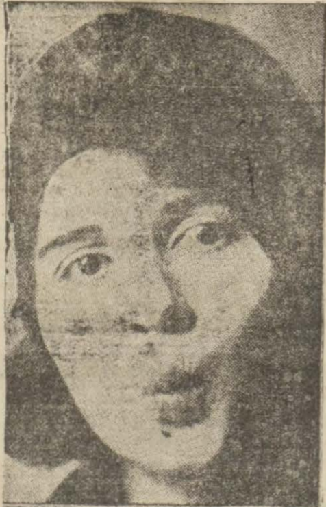
Dişlerin kapalı olduğu halde dudaklarımız ileriye doğru uzatıldıkça kadar uzatınız.

Dudaklara Hareket Vermek İçin Kadınların Yapması Lâzımgelen Hareketler