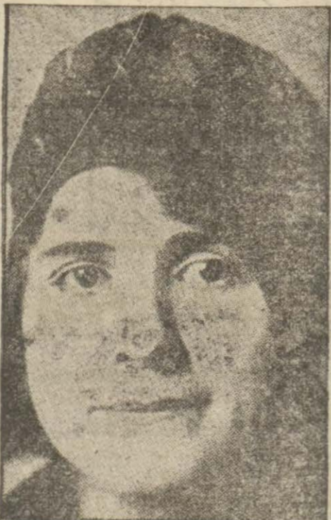
Gene dişlerin kapalı olduğu halde dudaklarımızı yayınız.