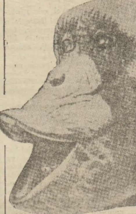
Hayvanlar arasında şampanze yüzünün hareketile meşhurdur. Bu hareket te dudaklarının büyüklüğü sayesinde mümkün olmaktadır.