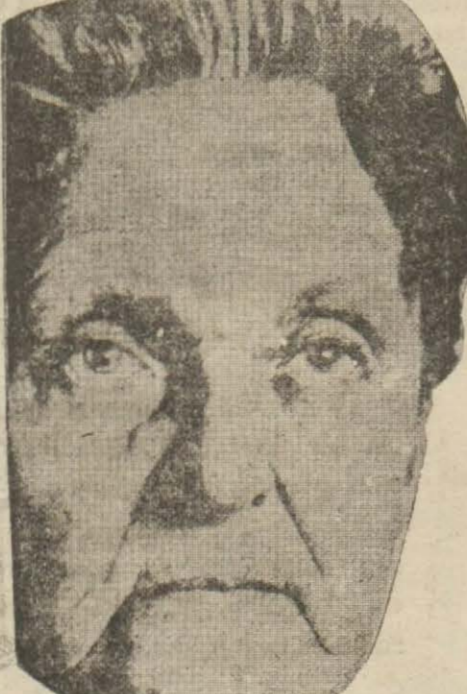
Bu da sessiz, fakat çelik tabiatlı bir adamın yüzüdür. Dudaklar ince ve ağız küçüktür.

Büyük ağızlı ve kalın dudaklı çocuklar artist ve aktör olabilirler. Fakat ince ve renksiz dudaklı çocuklar kendilerine daha küçükten başka meslek intihap etmezlerdir.