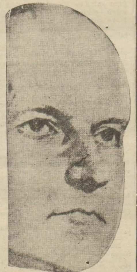
Amerikanın sabık reiscümhuru Koliç azim ve metanetile, sessiz ve hâkim tabiatile meşhurdur. Dudakları da ince ve kapalıdır.

İnsanlar iki kısma ayrılabilirler. Bir kısmı sakin ve makul düşüncelerle ikna eder ve edilirlir, ikinci kısmı da heyecanlarla hareket ederler.