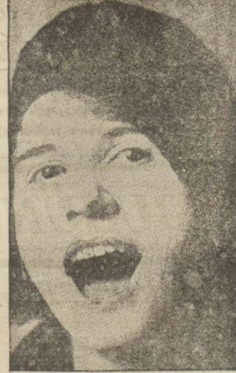
Sonra alt çenenizi aşağı sarılarak ağızınızı açabildiğiniz kadar açınız.