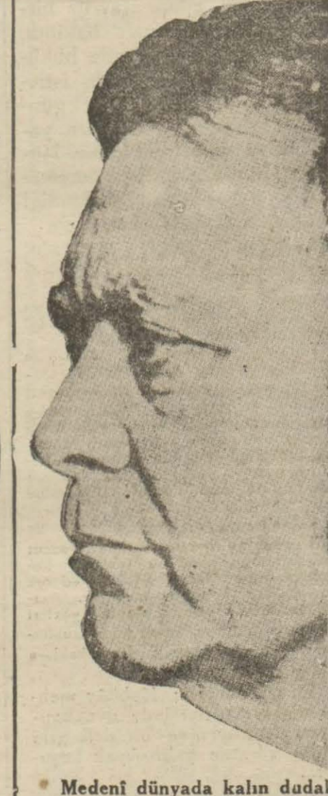
Medeni dünyada kalın dudaklı ve yüzü hareketli insanlar fazladır. Bu resim, heyecanlı hareketlerle meşhur olan Amerika âyan azasından birisine aittir.