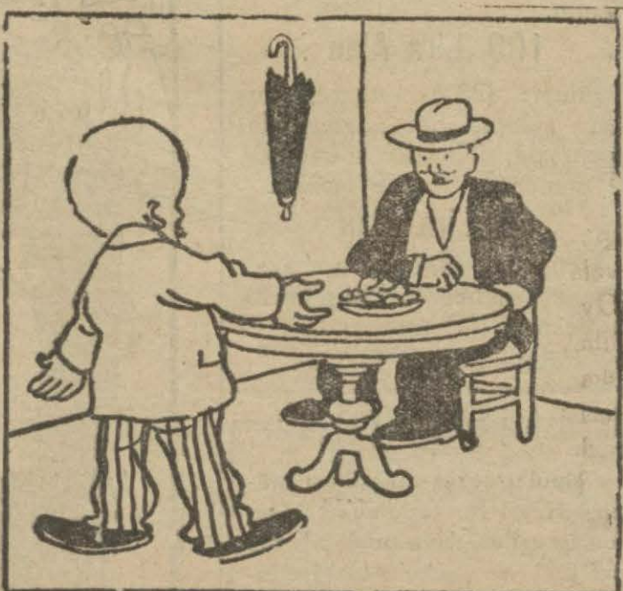
2: Komşu — Evde nişan atılır mı? Hasan B. — Öyle bir atılır ki gel de bak!