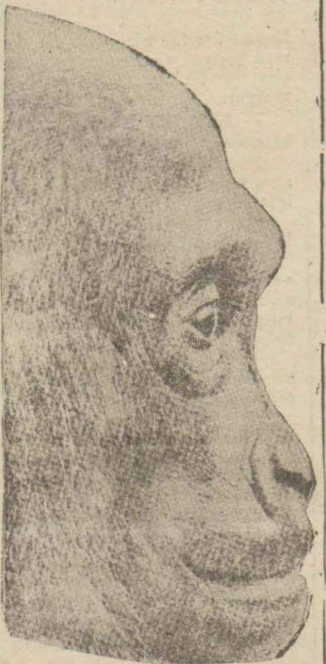
Goril, ormanların sessiz hayvanıdır. Dudaklar ince ve kansızdır. Yüzü hareketsiz ve ifade-sizdir.