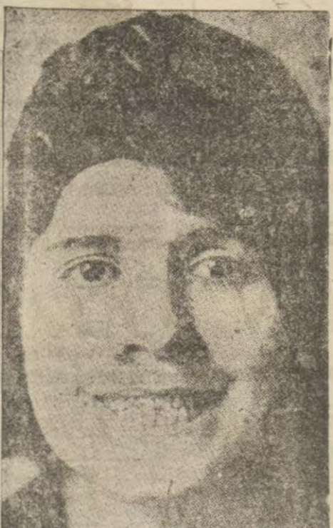
Tebessüm eder gibi dudaklarımızı açabildiğiniz kadar açınız.